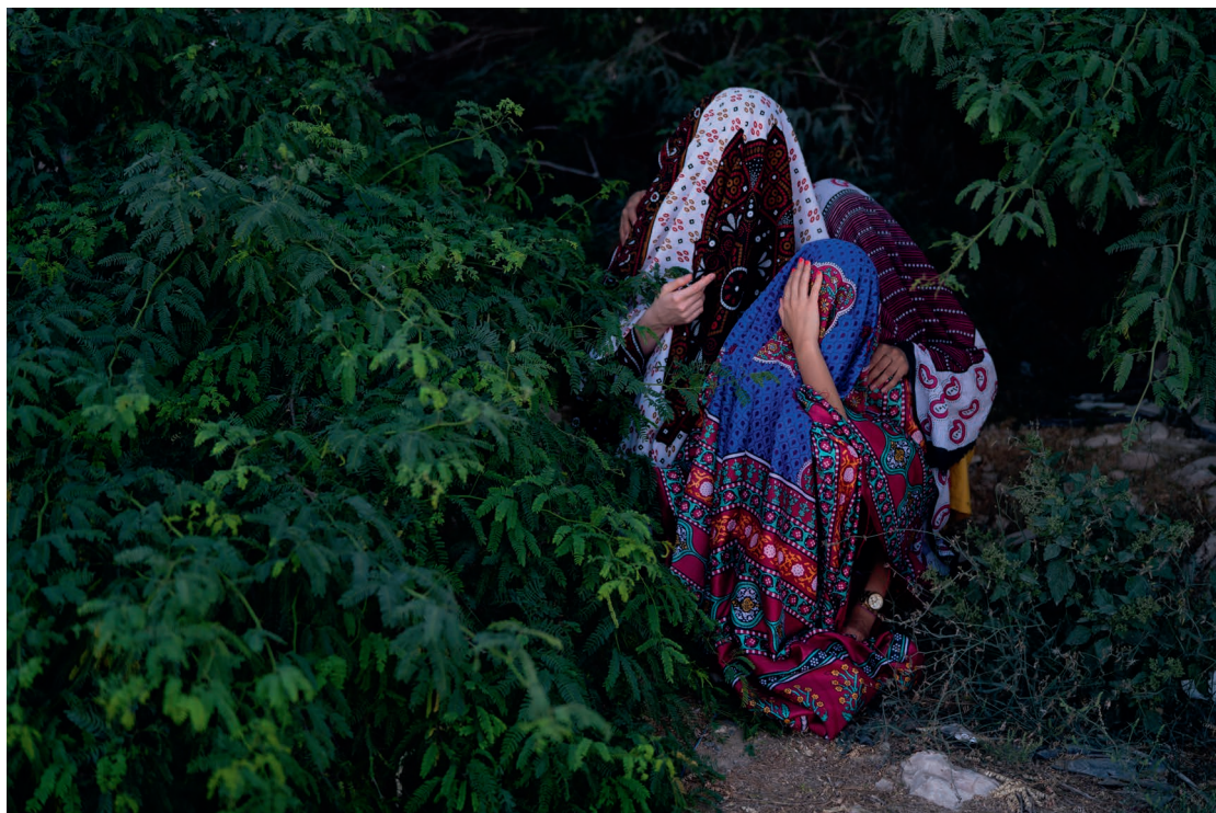
Shaima Al-Tamimi. Como si nunca hubiéramos venido , 2019