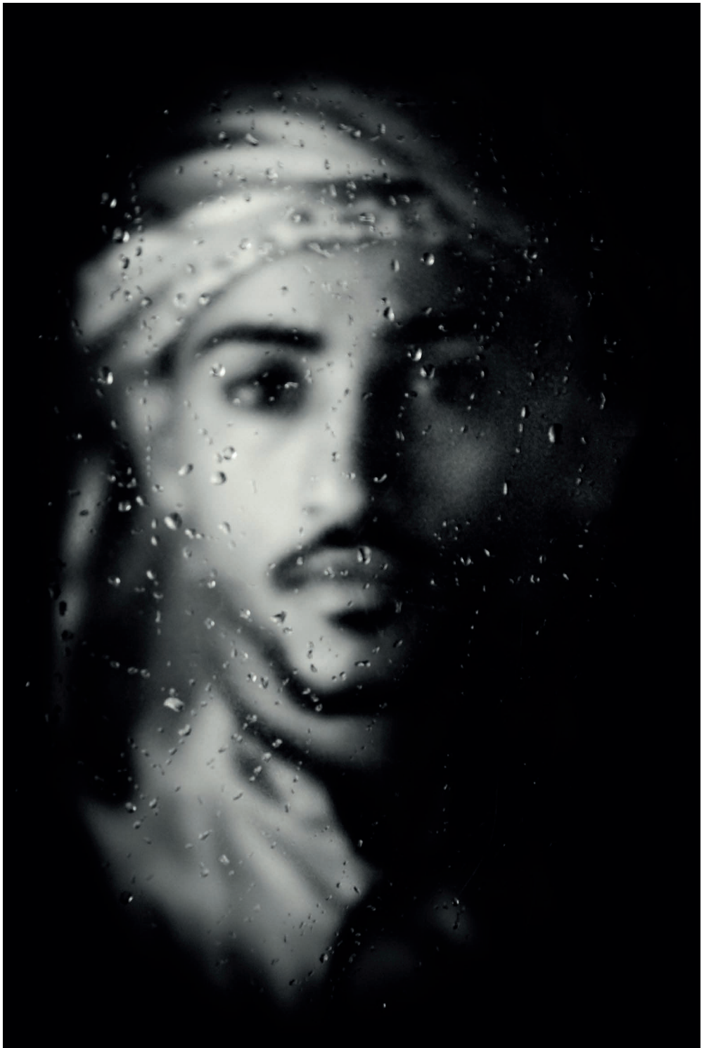
Thana Farooq. Suhil, No me reconozco en las sombras , 2017 © THANA FAROOQ