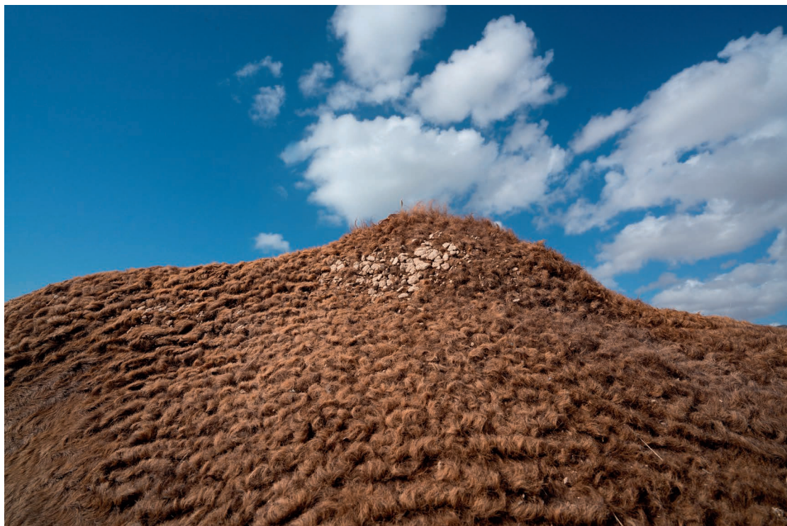
Shaima Al-Tamimi. Me pregunto qué se siente , 2019