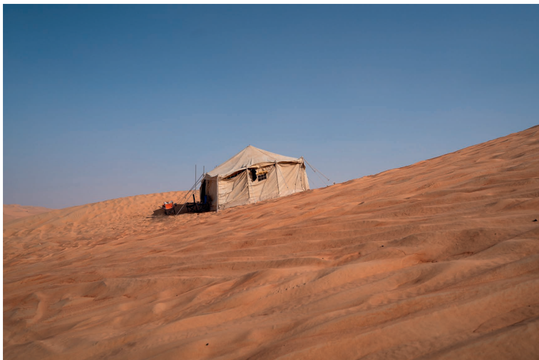
Shaima Al-Tamimi. Como si nunca hubiéramos venido , 2019 © SHAIMA AL-TAMIMI