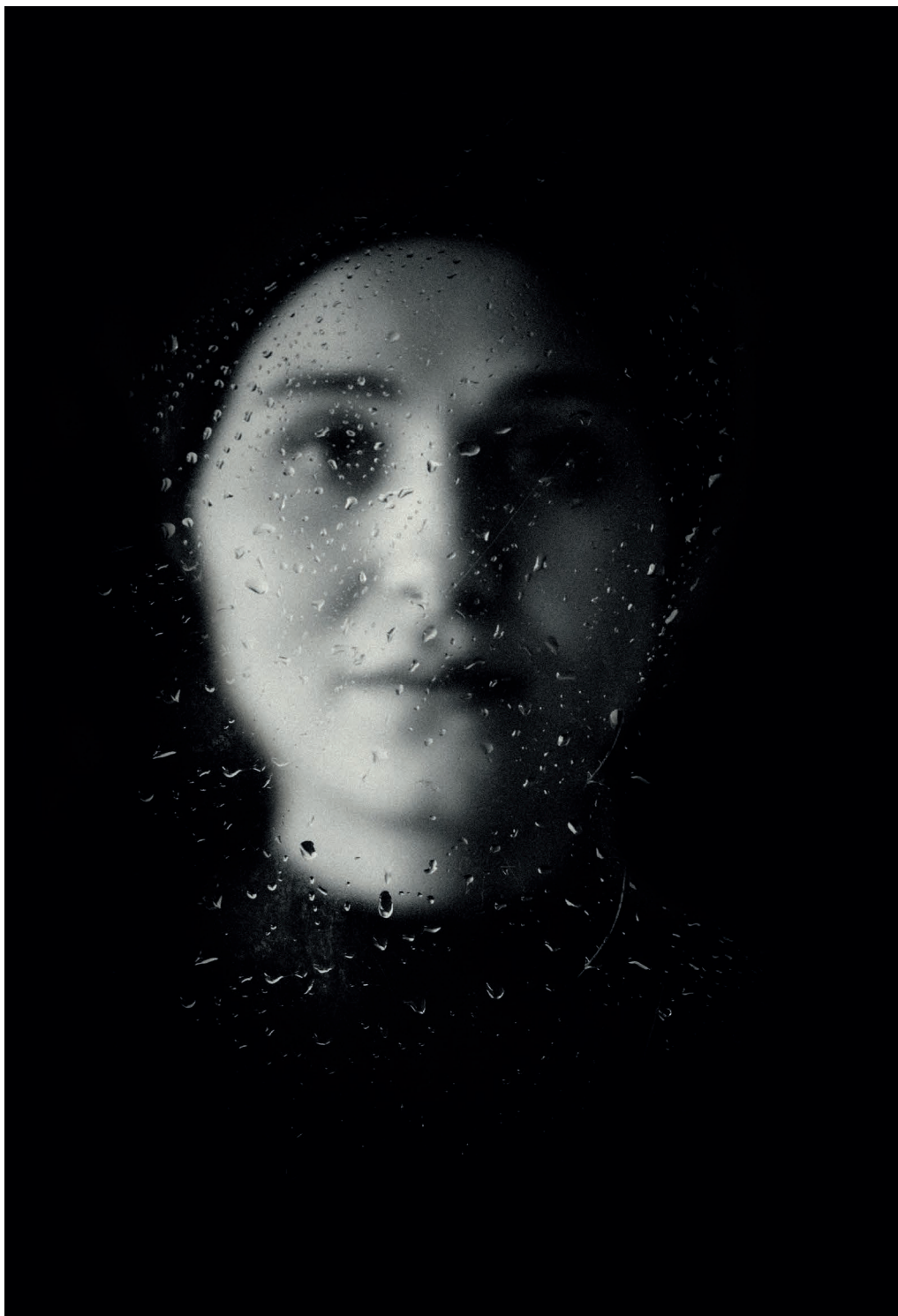
Thana Farooq. Noor, No me reconozco en las sombras , 2017 © THANA FAROQ