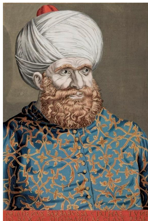
Foto: Jeireddín Barbarroja, por Agostino Veneziano, 1534

Las plazas inmersas en el territorio enemigo, la acción fundamental y destabilizadora del corso y la piratería o la necesidad de adaptarse a este nuevo modelo de contienda marcarán toda una serie de esfuerzos por ambas partes. Los ecos de ese inmenso conflicto todavía perduran en lugares como las islas de Chafarinas, Alhucemas o en el famoso peñón de Vélez de la Gomera, todos ellos de titularidad española en la actualidad. Esta conferencia abordará la lucha por el poder en el Mediterráneo y sus episodios más señeros en el mil seiscientos.