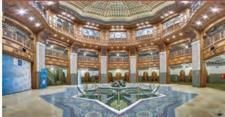
Sede de la Fundación Tres Culturas del Mediterráneo. Sevilla.

Todas las sesiones abiertas al público hasta completar aforo.