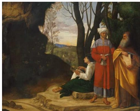
Foto: Giorgione- “Los tres filósofos” (1508-1509, Kunsthistorisches Museum, Viena)