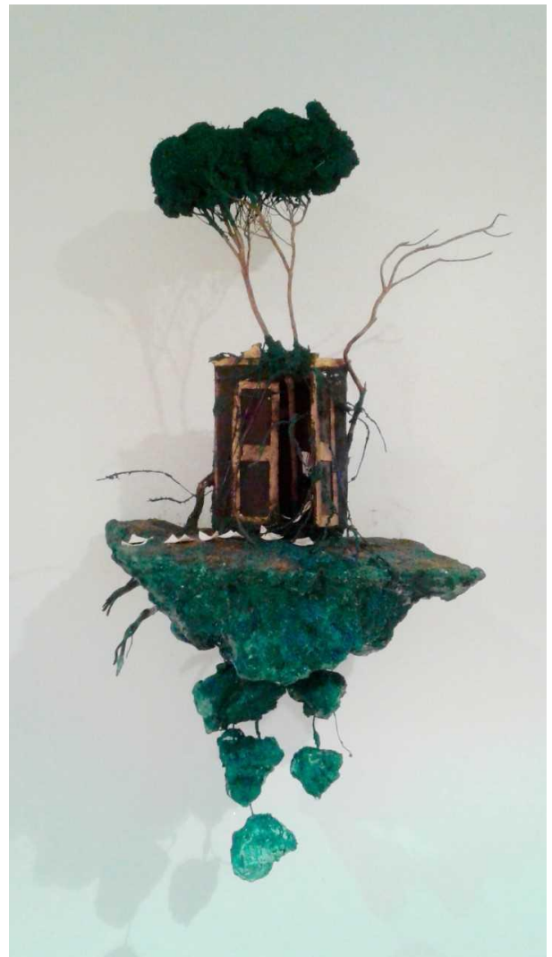
Foto: Historias de familias 2 (Yeso, cartón, esponja, alambre. 2018)

La escultura, como nos recuerda Heidegger, cumple la función de generar un nuevo espacio, un lugar para vivir y negociar procesos de identidad en la confrontación con el otro. La artista no podía menos que elegir el medio tridimensional de la escultura para hablar de las tres fases inherentes a estos procesos: la del desarraigo y exilio y, por lo tanto, la del sufrimiento; la de la negociación en el contacto entre unos y otros y, por lo tanto, la del ámbito de lo doméstico; y la de la resiliencia y la paz y, por tanto, la del descanso. Son las etapas de un proceso que involucra a los individuos, a las comunidades y al mundo.