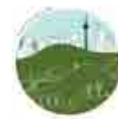
PUENTE DE VALLECAS