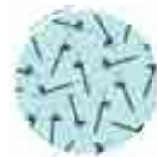
MONCLOA - ARAVACA