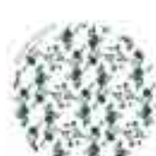
SAN BLAS - CANILLEJAS