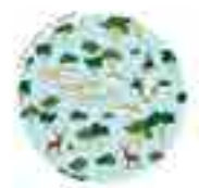
FUENCARRAL - EL PARDO