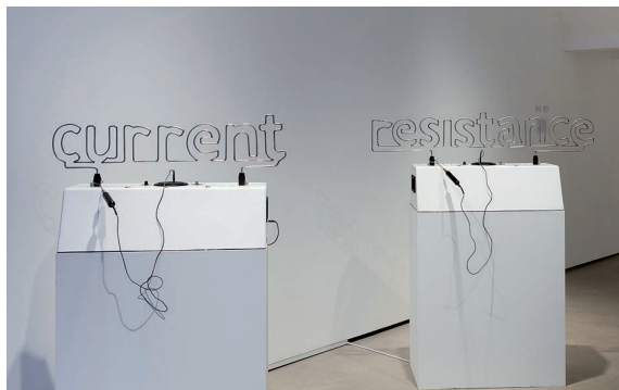
Buzz Words / The Current Resistance. 2015

Cortesía Yara El-Sherbini y La Caja Blanca.