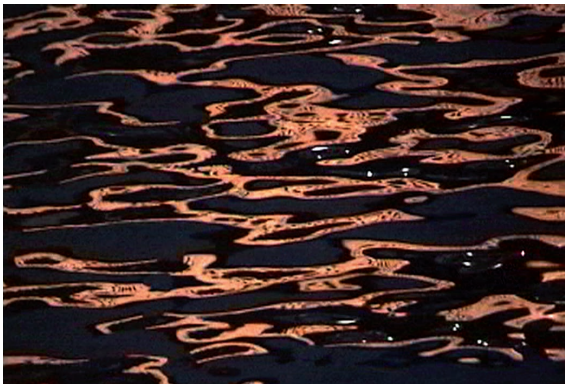
Blind Crossing. 2000

A través de diversas disciplinas —vídeo, instalación, fotografía, texto y performance — Ghani se centra en la investigación de cómo se reconstruye el pasado en el presente, y cómo se construye el presente para el futuro, a través del cambio en las narrativas tanto públicas como privadas. Su trabajo aborda temas sociopolíticos y antropológicos como la identidad del sujeto, la emigración y los derechos humanos. Ha expuesto en Rotterdam Film Festival (2013), Documenta 13 (Kassel, 2012), Sharjah Biennial (EAU, 2009), Brooklyn Museum (2005), Tate Modern (Londres, 2007), National Gallery (Londres, 2008), Museum of Modern Art (Nueva York, 2011), CCCB Centre de Cultura Contemporània de Barcelona (2014), Saint Louis Art Museum (Missouri, 2015), Queens Museum of Art (Queens, Nueva York, 2016), Es Baluard, Museu d'Art Contemporani (Palma Mallorca, 2016) y San Telmo Museoa (Donostia/San Sebastián, 2017). Ha participado en Bienales y Festivales como Liverpool Biennial, Sharjah Biennial, Documenta(13) en Kassel y Kabul, Asian Art Biennial y Architecture Film Festival, Rotterdam, Holanda.