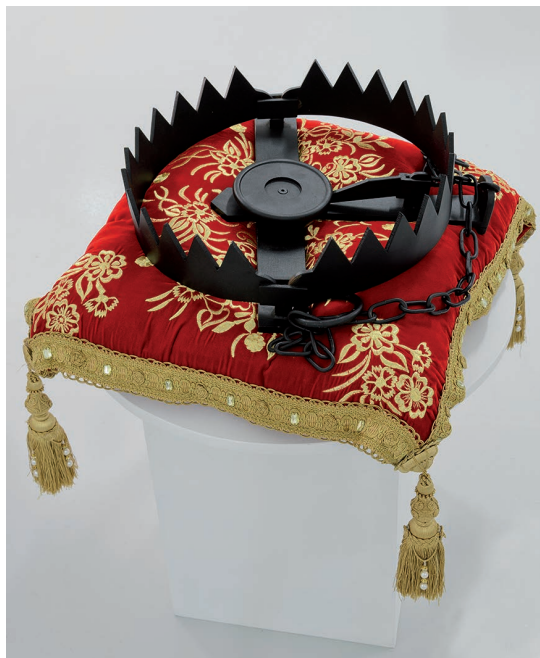
Piège à loup . 2014

Desde 1986, su trabajo ha sido presentado en la Bienal de El Cairo (1993), Instituto Francés de Casablanca (1995), Museo Nacional de la Mujer y las Artes (Washington DC, EE.UU. 1997), Museo Kerava (Finlandia, 2003), Museo de Marrakech (2004), Casa Árabe (Madrid, 2008), Bienal de Alejandría (2009), Feria de Arte de Bruselas (2010) y Marrakech Art Fair (2010), Docks Art Fair Lyon (2011), Galería Artae Lyon (2011), Bienal de Lyon (2011), Feria de Arte de Dubai (2014), Centro de Arte Contemporáneo de Viena (2014), Museo de Mohamed VI de Arte Moderno y Contemporáneo de Rabat (2014) y Museo de la fotografía y artes visuales de Marrakech (2015), Es Baluard, Museu d'art Contemporani (Palma de Mallorca, 2016), African Fair London (2016) y San Telmo Museoa (Donostia/San Sebastián, 2017).