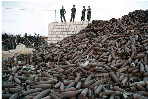
War Remains. 2012