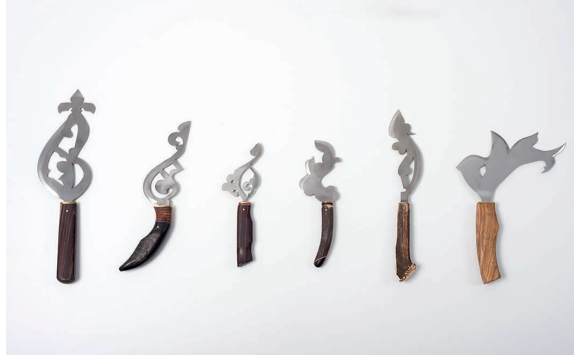
Les couteaux. 2013

Las obras de Zoulikha Bouabdellah han sido expuestas en el Museo Kunst Palast (Düsseldorf, 2004), Museo de Arte Mori (Tokio, 2006), Moderna Museet (Estocolmo, 2006), Museo de Arte Moderno Fundación Ludwig (Viena, 2006), Museo de Brooklyn (Nueva York, 2007), Es Baluard, Museu d'art Contemporani (Palma de Mallorca, 2016), San Telmo Museoa (Donostia/San Sebastián, 2017), entre otras instituciones. Bouabdellah ha participado en varias bienales y festivales como la Bienal de Fotografía Africana de Bamako (2003), la Bienal de Venecia (2007), y la Trienal de Aichi (2010). En 2016 el CAAM Centro Atlántico de Arte Moderno (Las Palmas de Gran Canaria, España) acogió una extensa exposición individual dedicada a la artista.