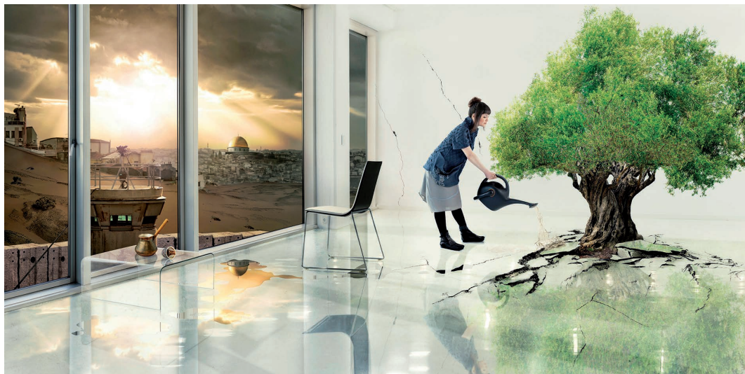
Nation Estate . 2012