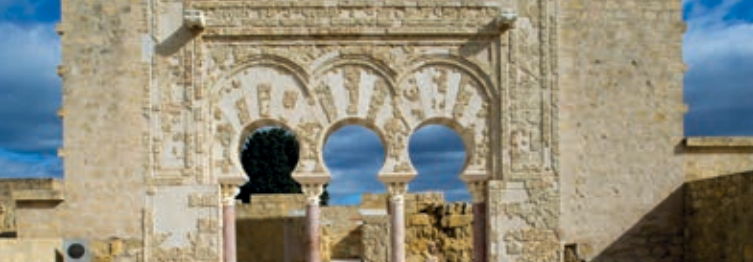
Conjunto Arqueológico de Madinat al-Zahra. Córdoba, España