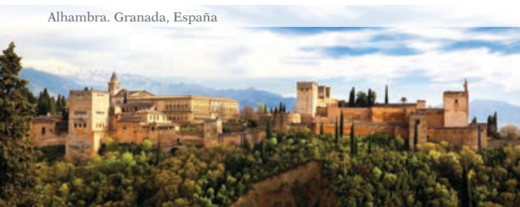
Alhambra. Granada, España

Consejero de Cultura de la Junta de Andalucía.