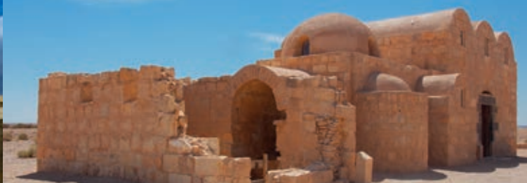
Quseir Amra, Jordania.