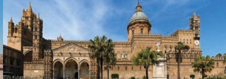
Catedral de Palermo. Sicilia. Italia