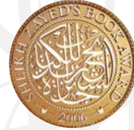
جائزة الشيخ زايد للكتاب Sheikh Zayed Book Award