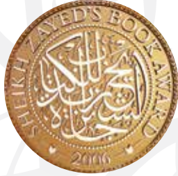
جائزة الشيخ زايد للكتاب Sheikh Zayed Book Award