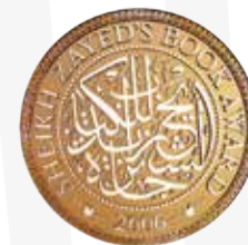
جائزة الشيخ زايد للكتاب Sheikh Zayed Book Award