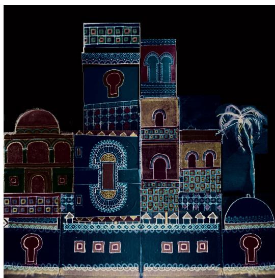
Bizancio y Damasco. Collage digital de dibujos en textiles "1001 Noches II" (50 x 50 cm). Obra de José Alberto López.